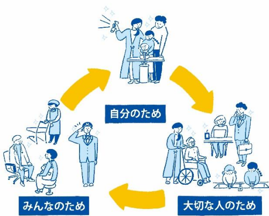
▲『キレイのリレー』概念図

「『キレイのリレー』プロジェクト」は、様々な事業者との協働により“大切な誰かを想い、清潔衛生行動をとることが、自分の生活を支える誰かの笑顔を生み出していく”という考えを伝えるために、本プロジェクトの趣旨にご賛同頂いた事業者の方々と一緒に、人と人との触れ合いにあふれ、人と寄り添いながら、もっと前向きに過ごせる社会を目指していくプロジェクトです。